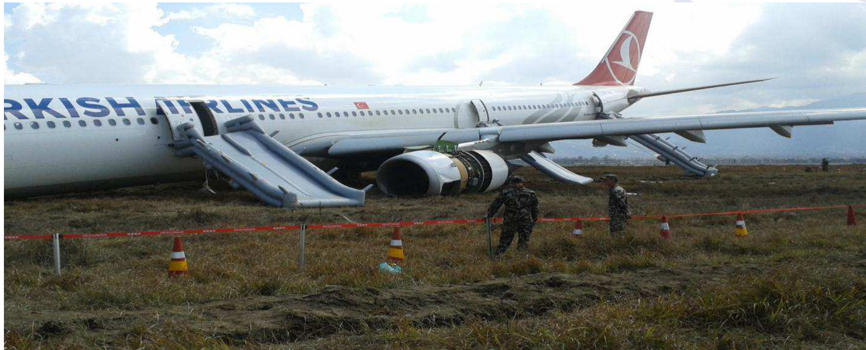
Imagen: Final Report on the Investigation of the Accident of TC-JOC, A330-303, at TIA , KTM on 4 March