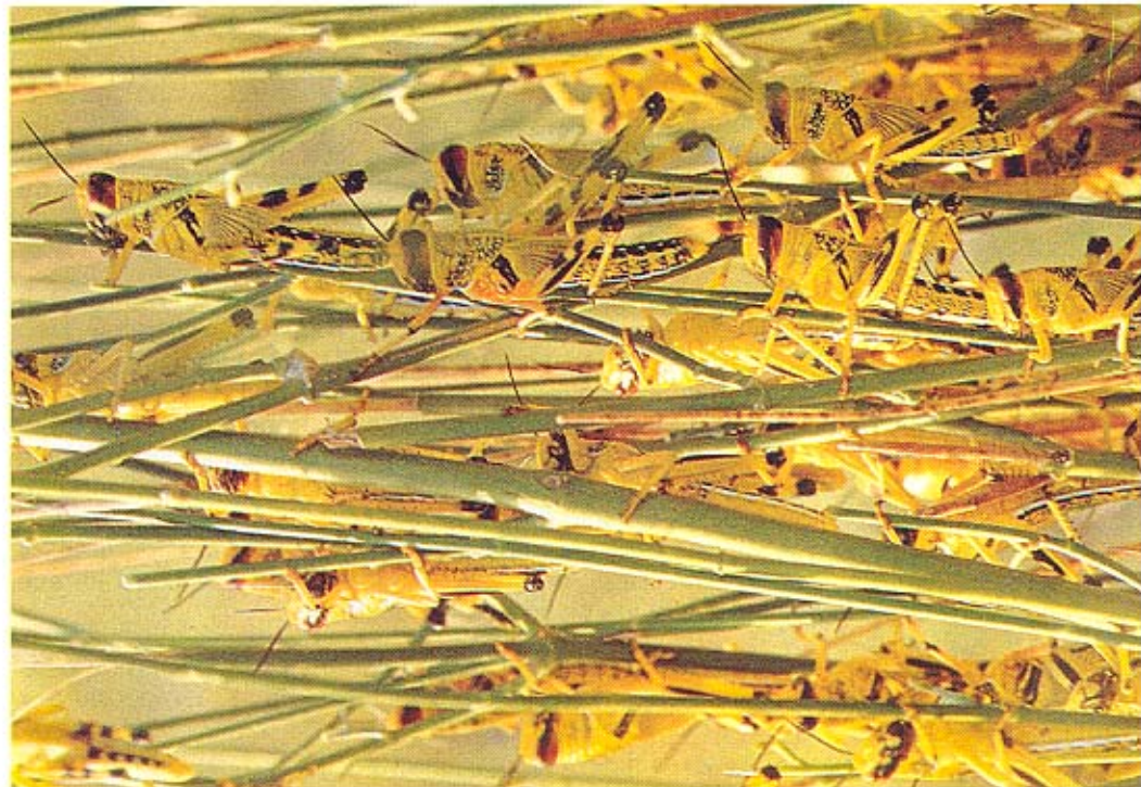
Enjambre de Schistocerca gregaria (Fokskal, 1775) en Marruecos

La lluvia afecta a la reproducción de la langosta de manera muy importante, pues la hembra deposita sus huevos en racimos del orden de una centena en un suelo húmedo y a una profundidad de 5 a 15 cm, de modo que una precipitación de 20 mm puede ser generalmente suficiente para humedecer el suelo adecuadamente para dicha puesta. Si las precipitaciones son más abundantes, permiten mantener el grado de humedad necesario para la reproducción durante varias semanas, a la vez que favorecen el desarrollo de la vegetación que sirva de alimento a las larvas hasta alcanzar el estado adulto. Por otra parte, cuando las langostas aladas llegan a un suelo húmedo pueden madurar sexualmente en una semana y comenzar la puesta de huevos inmediatamente. Si, por el contrario, las lluvias son excesivamente copiosas, retrasan la maduración.