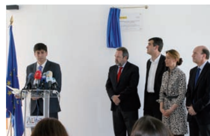
Interviene el Presidente de la Agencia