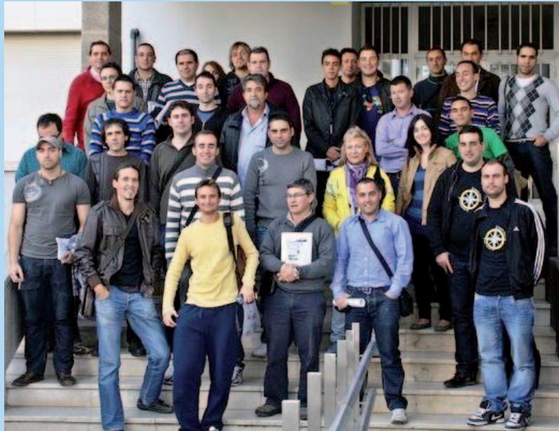
Los miembros de la Asociación, tras una asamblea