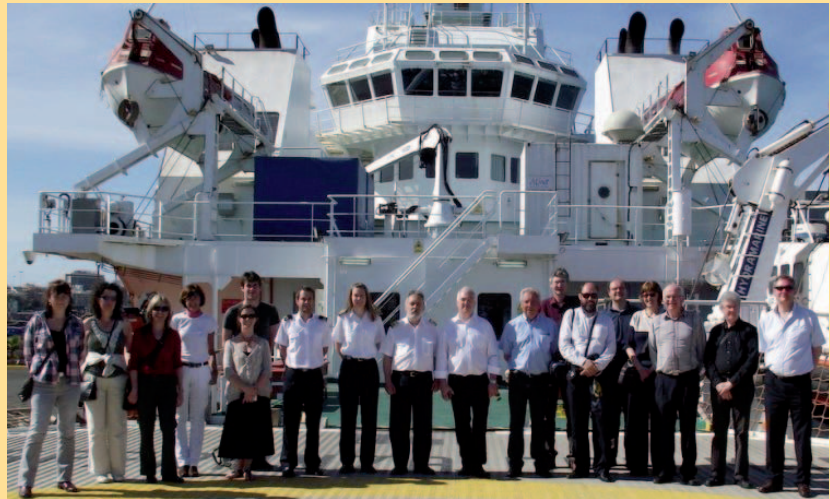
Los participantes, a bordo del buque «Esperanza del Mar»

La AME organiza, del 28 al 30 de mayo de 2012, sus XXXII Jornadas Científicas bajo el lema "Meteorología y Calidad del Aire" y el 13º Congreso Hispanoluso de Meteorología, de común acuerdo con la Asociación Portuguesa de Meteorología y Geofísica y la colaboración de la Agencia Estatal de Meteorología.