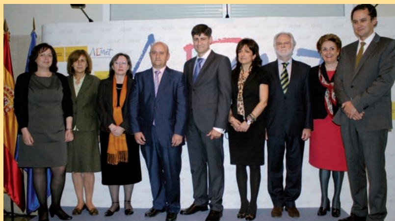
El Presidente, en el centro, con sus colaboradores