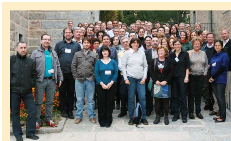
Todos los asistentes a la reunión