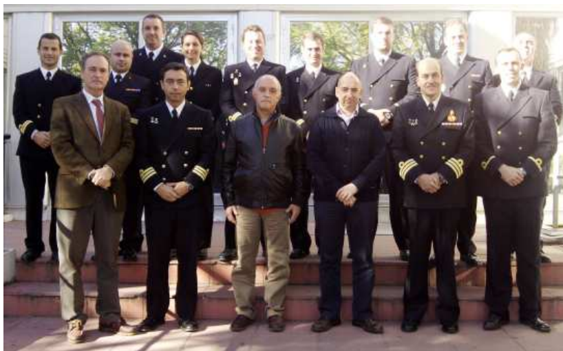
Los militares de la Armada con el delegado de AEMET, a la izquierda

Empresa e Investigación a través de la Fundación Séneca-Agencia de Ciencia y Tecnología de la Región de Murcia. Esta edición, la XII, tuvo lugar entre los días 22 y 24 de noviembre pasado.