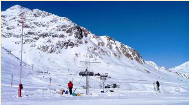
Instalación de los pluviómetros en el Pirineo aragonés