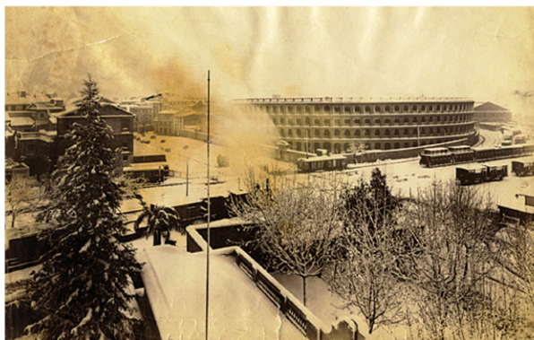
Plaza de toros de Valencia fotografiada en la nevada del 15 al 17 de enero de 1885. Perteneció a los fondos de fotografía antigua del Museo Sorolla de Madrid y fue datada con precisión gracias a los datos del archivo de la DT en Valencia.

un índice específico de riesgo que el usuario valora muy positivamente dada su utilidad a la hora de establecer planes de actuación. Con la Confederación Hidrográfica del Júcar se tiene una especial relación ya que, a raíz de la puesta en marcha de su SAIH. Este sistema permite disponer cada 5 minutos de información de la precipitación en alrededor de 180 pluviómetros automáticos. Desde 1991 se dispone en tiempo real de los datos de dicha red, lo que permite mejorar la vigilancia de los diferentes episodios meteorológicos y comprender la estructura de las precipitaciones en esta zona, que en numerosas ocasiones alcanzan intensidades muy por encima del umbral de torrencial. Igualmente, ha habido una tradicional y buena relación con la Universidad de Valencia, participando personal de la Delegación en numerosos proyectos de investigación, realizando diversas tesis doctorales y permitiendo hacer