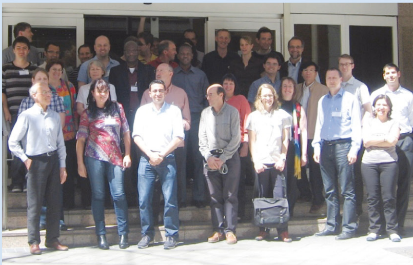
Participantes en la reunión de usuarios y meteorólogos del NWC-SAF.