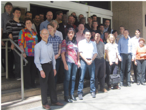
Los participantes en la reunión.