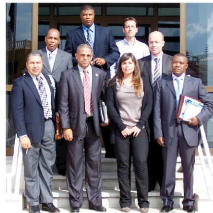
El ministro de caboverdiano junto a la Delegada de AEMET.

El pasado 13 de mayo, de la mano del Director del CECOES 1-1-2, visitó la Delegación de AEMET en Canarias el Ministro del Interior de Cabo Verde junto con tres altos cargos del país. El objetivo de la visita era el conocimiento de la actuación de AEMET en relación con los fenómenos meteorológicos adversos y el trabajo que se realiza junto con el 1-1-2. En Cabo Verde están comenzando a diseñar un servicio de emergencias y Canarias puede ser un modelo a seguir. Se realizó por parte de la Delegada Territorial una presentación del Plan Meteocalera y del protocolo utilizado en situaciones de aviso meteorológico y finalmente se visitaron las instalaciones del Grupo de Predicción y Vigilancia.