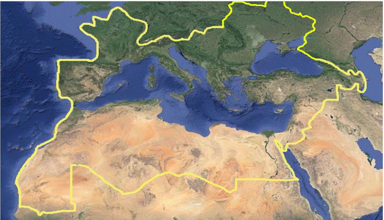
Figura 2. Dominio cubierto por los países participantes en MedCOF.

MedCOF engloba a 34 países alrededor del Mediterráneo (véase figura 2) y sirve de paraguas a los dos RCOF subregionales SEECOF ( http://www.seevccc.rs ) y PRESANORD que abarcan respectivamente la zona de la península de los Balcanes (incluyendo Turquía e Israel) y el norte de África. AEMET coordina MedCOF desde su inicio en 2013, manteniendo su página web ( http://medcof.aemet.es ) y organizando tanto las sesiones presenciales como remotas. Para ello se ha generado un procedimiento en el que contribuyen de forma esencial los RCC de las AR VI y I, los GPC con sede en la AR VI y diversos centros de investigación (p. ej., BSC, CMCC, IBIMET, etc.)