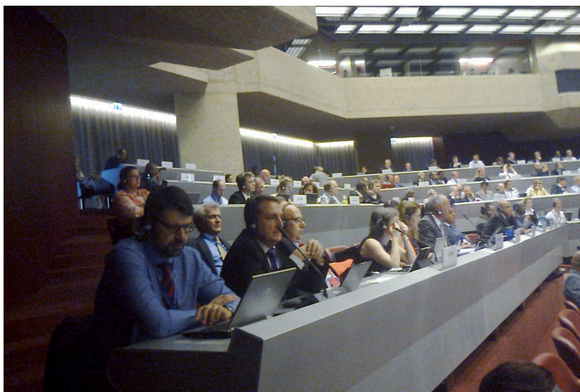
Imagen de la delegación española