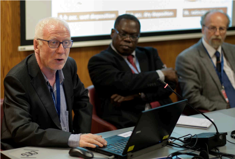
Conferencia de Terradellas sobre el BDFC