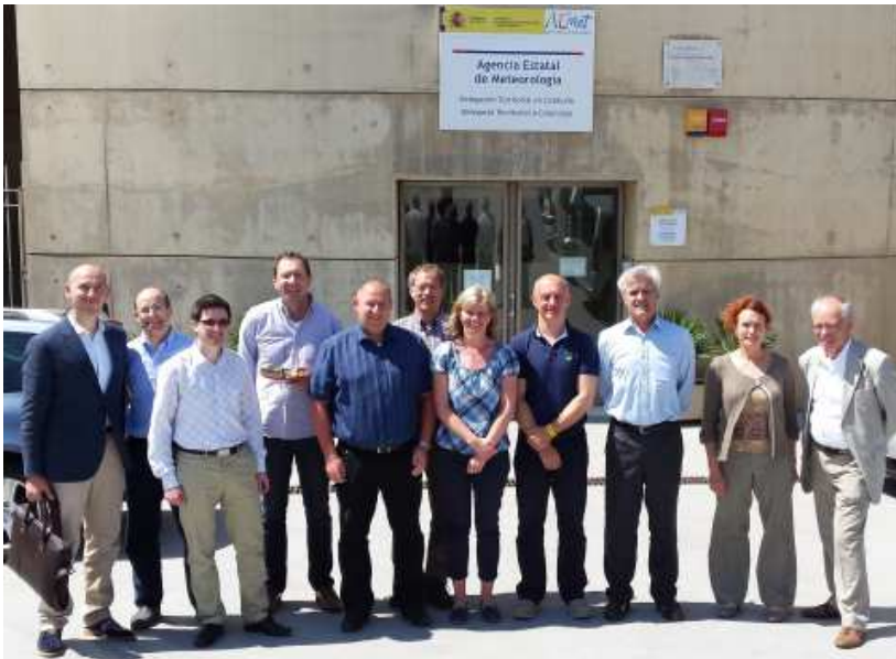
Los participantes en la reunión, ante la Delegación Territorial en Cataluña