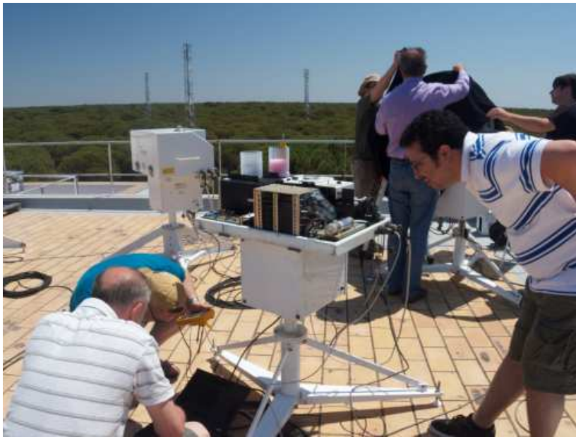
Los técnicos, en plena actividad calibradora