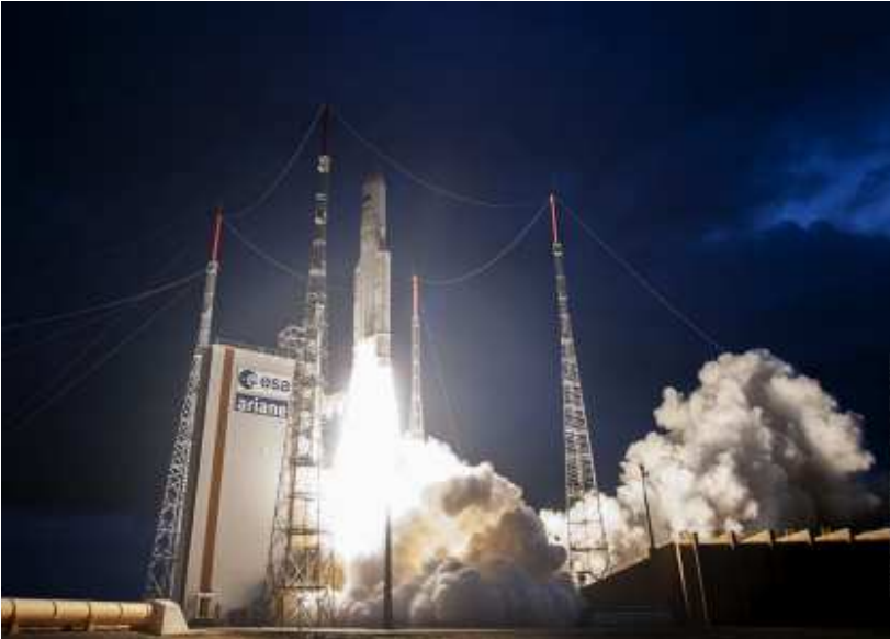
Momento del despegue desde la Guayana francesa