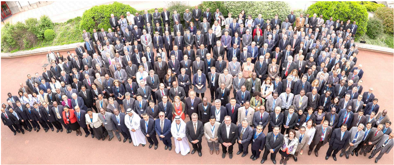
Representantes de la gran familia de la OMM