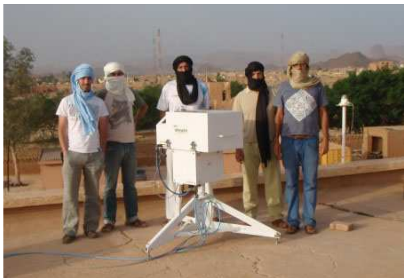
Funcionarios del CIAI calibran equipos en el norte de África

MEDARE es considerado ejemplo de éxito en la OMM y se pretende replicar en otras regiones como el Océano Índico.