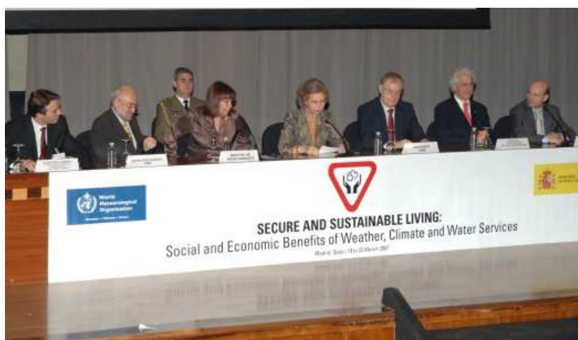
Inauguración de la Conferencia de la OMM en Madrid, marzo de 2007

Actualmente España es uno de los miembros más activos de la OMM. A través de sus representantes permanentes, pertenece al Consejo Ejecutivo desde 2003. Además de su participación en los programas regulares de la OMM, España se ha implicado en otros programas y proyectos tanto operativos, como el Centro de Predicción de Polvo Atmosférico para el norte de África, Oriente Medio y Europa o Medcof, como de cooperación al desarrollo en Iberoamérica y África.