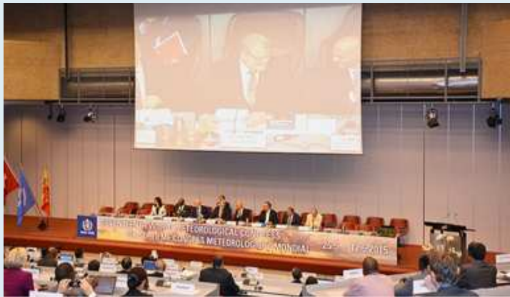
Acto de apertura del Congreso