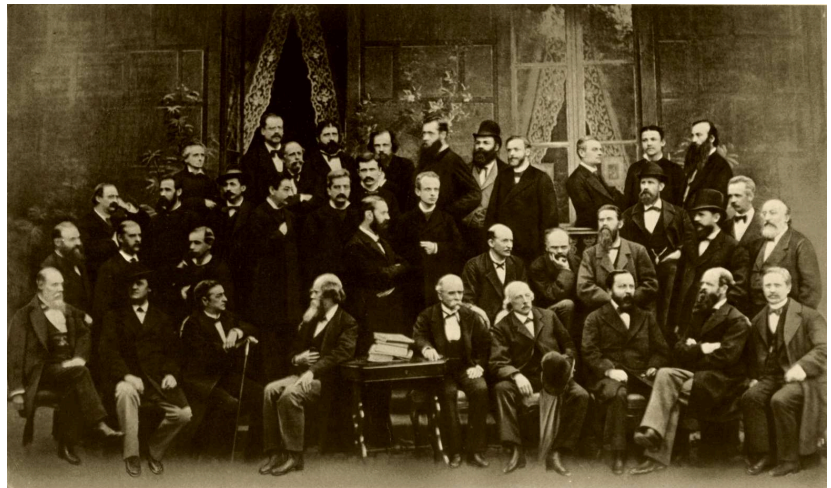
Segundo Congreso Meteorológico Internacional, Roma 1879