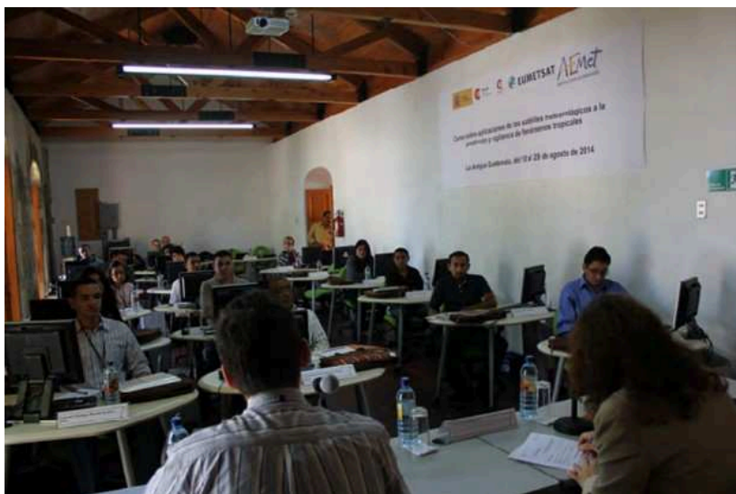
XI Curso Iberoamericano de Meteorología Satelital, Antigua Guatemala

La Red Iberoamericana de Oficinas de Cambio Climático (RIOCC), coordinada por la Oficina Española de Cambio Climático, se creó en 2004 con el objetivo de mantener un diálogo fluido y permanente con los países iberoamericanos en materia de cambio climático. La Red trabaja en el ámbito de la mitigación y de la adaptación al cambio climático. Las actividades en áreas tales como observación sistemática,