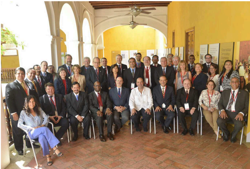
Reunión de la Conferencia de directores de SMHI - CIMHET

— HEALTHMET : refuerzo institucional de los servicios meteorológicos y creación de vínculos con las autoridades sanitarias. Se promueve la creación de grupos de trabajo clima-salud a nivel nacional, creando sinergias con otros proyectos de la cooperación española (predicción de tormentas de polvo y arena) y del Marco Mundial de Servicios Climáticos.