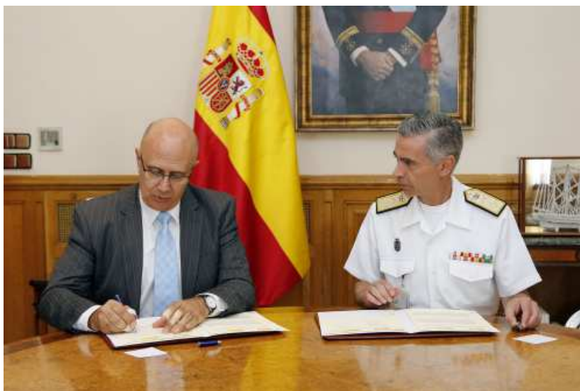
Momento de la firma del Presidente de AEMET y el Jefe del E. M. de la Defensa