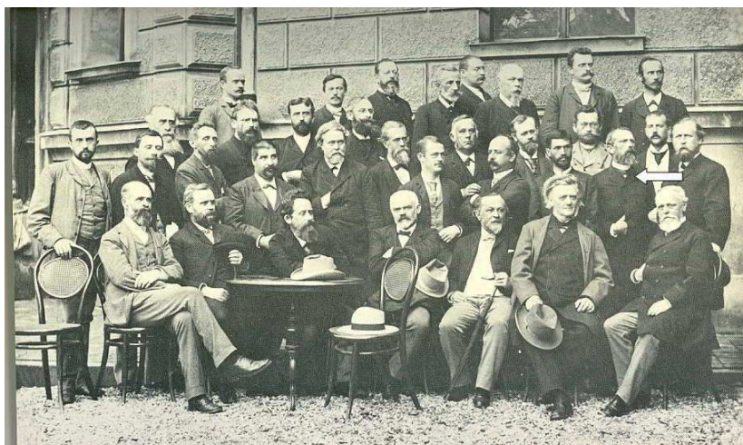
Conferencia de directores de la OMI, Munich 1891