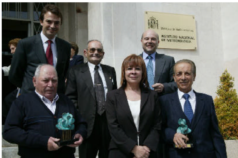
La Ministra de Medio Ambiente con los tres premiados, el Secretario General para la Prevención de la Contaminación y del Cambio Climático y el Director General del INM