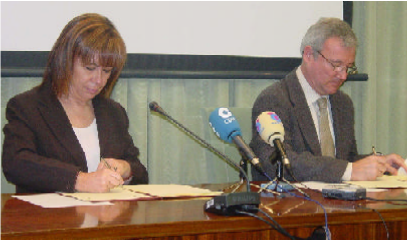
Cristina Narbona y Ramón Luís Valcárcel firman el acuerdo