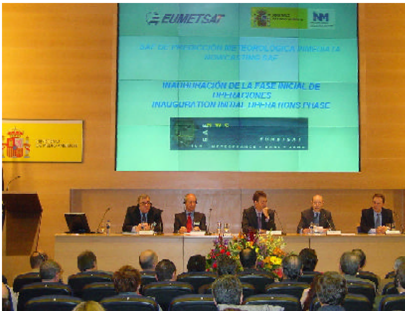
Mesa que presidió el acto en el ministerio de Medio Ambiente