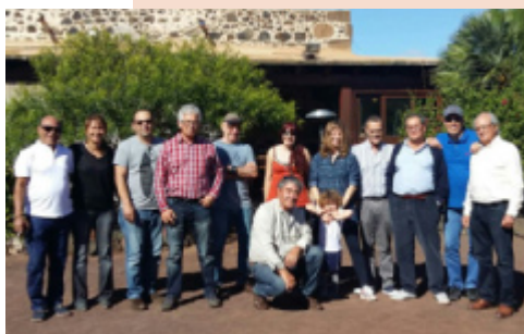
Foto de grupo de los asistentes al acto de hermanamiento