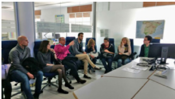
Los visitantes, recibiendo explicaciones del trabajo en el Centro Nacional de Predicción

La duración prevista de las visitas fue de alrededor de una hora, aunque dado el enorme interés mostrado por los grupos de visitantes —necesariamente reducidos para no interferir en el trabajo diario de los profesionales de la Agencia—, en algunos casos ese tiempo se sobrepasó ampliamente.