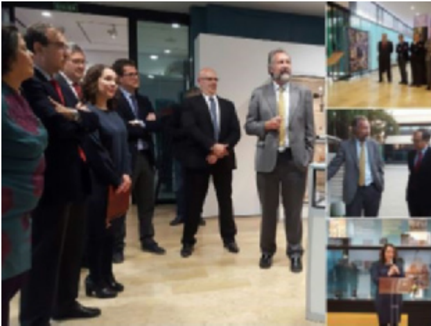
Unos momentos de la inauguración de la exposición «La Agencia Estatal de Meteorología a través del tiempo»