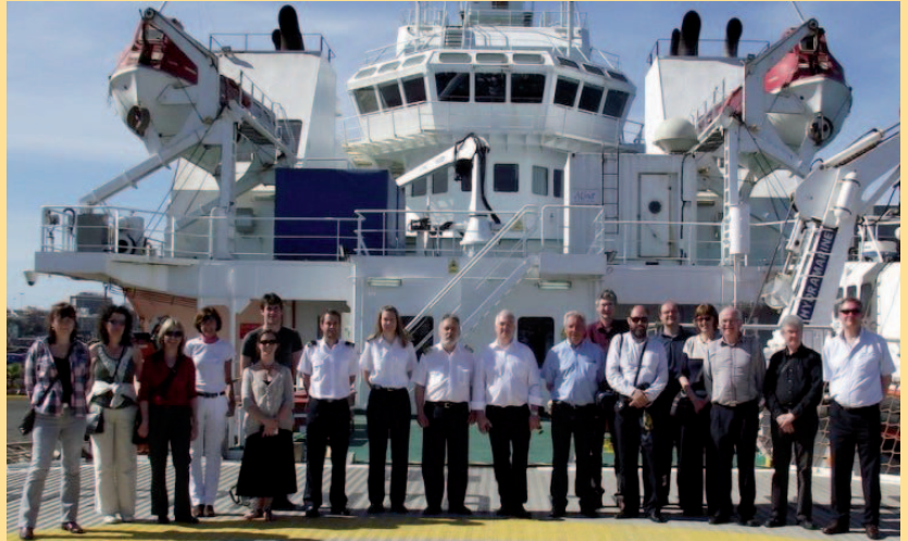
Los participantes, a bordo del buque «Esperanza del Mar»

La AME organiza, del 28 al 30 de mayo de 2012, sus XXXII Jornadas Científicas bajo el lema "Meteorología y Calidad del Aire" y el 13º Congreso Hispanoluso de Meteorología, de común acuerdo con la Asociación Portuguesa de Meteorología y Geofísica y la colaboración de la Agencia Estatal de Meteorología.