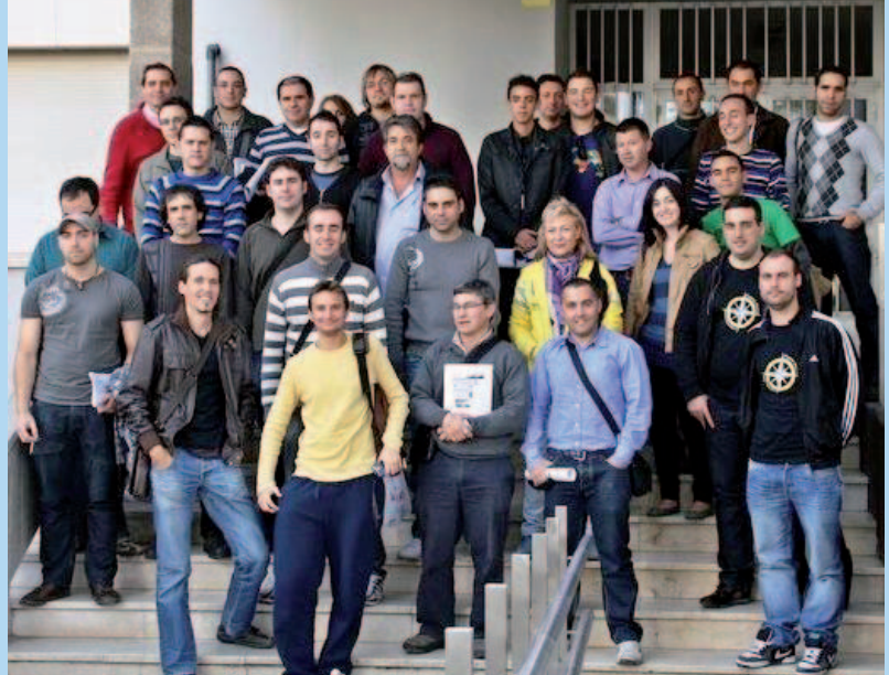
Los miembros de la Asociación, tras una asamblea