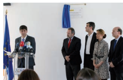
Interviene el Presidente de la Agencia