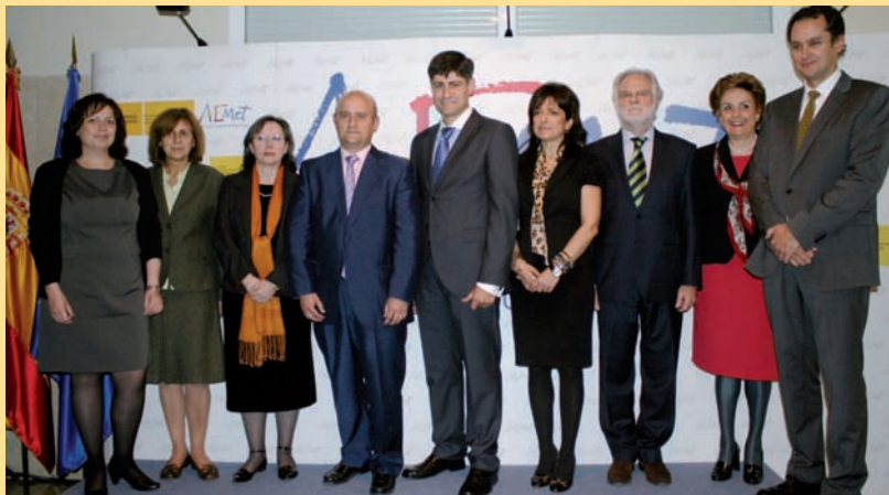
El Presidente, en el centro, con sus colaboradores