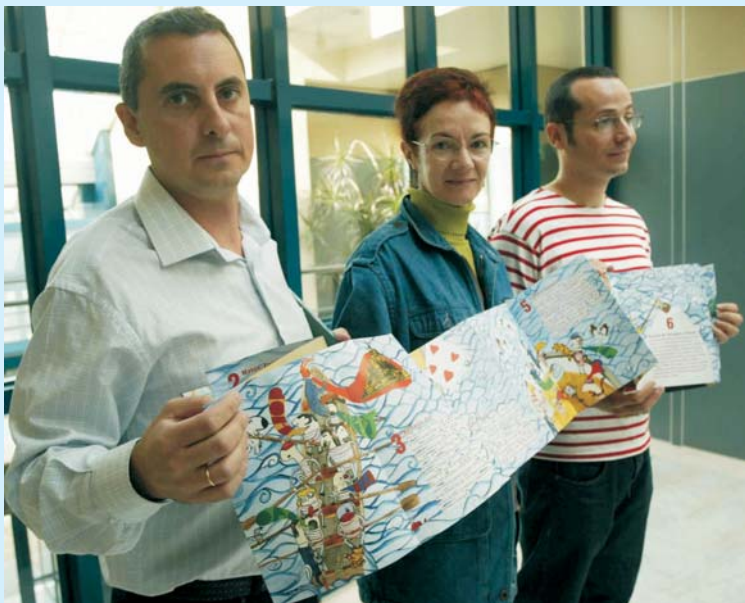
Los autores, con la Directora del CMT, muestran el desplegable