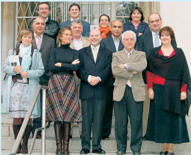
Los asistentes al Curso, con el Director General en el centro (Foto T.H.)

Dada la gran aceptación y el éxito de esta Jornada se prevé llevarla a cabo aproximadamente cada seis meses estando, previsto celebrar la siguiente en fechas cercanas al Día Meteorológico Mundial del próximo año.