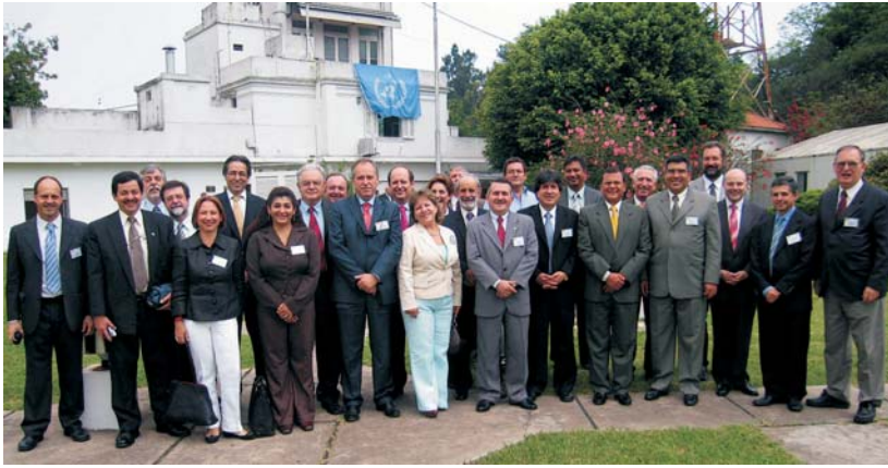
Foto de familia tras el nutrido encuentro en Buenos Aires