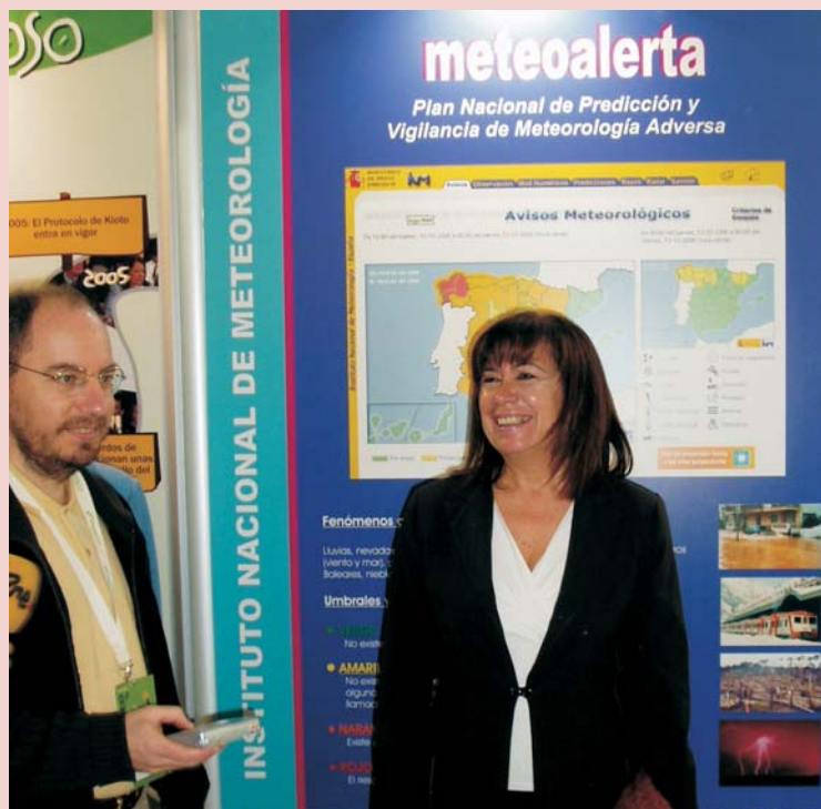
Cristina Narbona, con los periodistas, ante el cartel de Meteoalerta