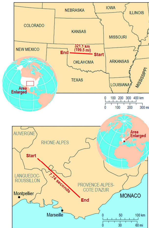
Maps indicating the geographic locations of the verified longest duration and longest distance lightning flashes for the Earth

by the WMO in 2017 –The highest temperature for the “Antarctica Region” (defined by the WMO and United Nations as all land and ice south of 60°S) of 19.8 °C (67.6 °Fahrenheit) was observed on 30 January 1982 at Signy Research Station, Borge Bay on Signy Island. The highest temperature for the “Antarctic continent” (defined as the main continental landmass and adjoining islands) is the temperature extreme of 17.5 °C (63.5 °F) recorded on 24 March 2015 at the Argentine Research Base Esperanza located near the northern tip of the Antarctic Peninsula. Thirdly, the highest temperature for the Antarctic Plateau [at or above 2500 meters (8202 feet)] was the observation of -7.0 °C (19.4 °F) made on 28 December 1980 at an Automatic Weather Station (AWS) site D-80 located inland of the Adélie Coast. The lowest temperature yet recorded by ground measurements for the Antarctic Region, and for the whole world, remained the record of -89.2 °C at Vostok station on 21 July 1983 (Skansi et al. 2017).